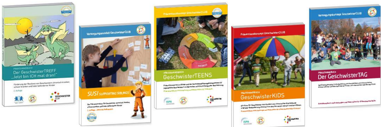
Abbildung aller Handbücher des GeschwisterCLUBs.

Um die Prozessqualität in den anbietenden Einrichtungen zu sichern, wurden Handbücher für die standardisierte Kursdurchführung für GeschwisterTREFF „Jetzt bin ICH mal dran!“, SuSi, GeschwisterTEENS, GeschwisterKIDS und GeschwisterTAG veröffentlicht.